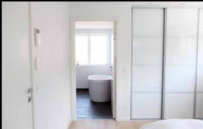
Villa i Hjerding: Villaen set indefra med bl.a. skydelåger og Philippe Starck badekar. Uno form køkken - model classic, lydlofter, ovenlys, skorsten med dobbeltsidet brændeovn og mange andre specialløsninger.

Vi tager os af alt i hele byggeprocessen. På den måde skal du kun forholde dig til én samarbejdspartner og kan nyde forløbet fra bar byggegrund til nøglefærdigt drømmehus.