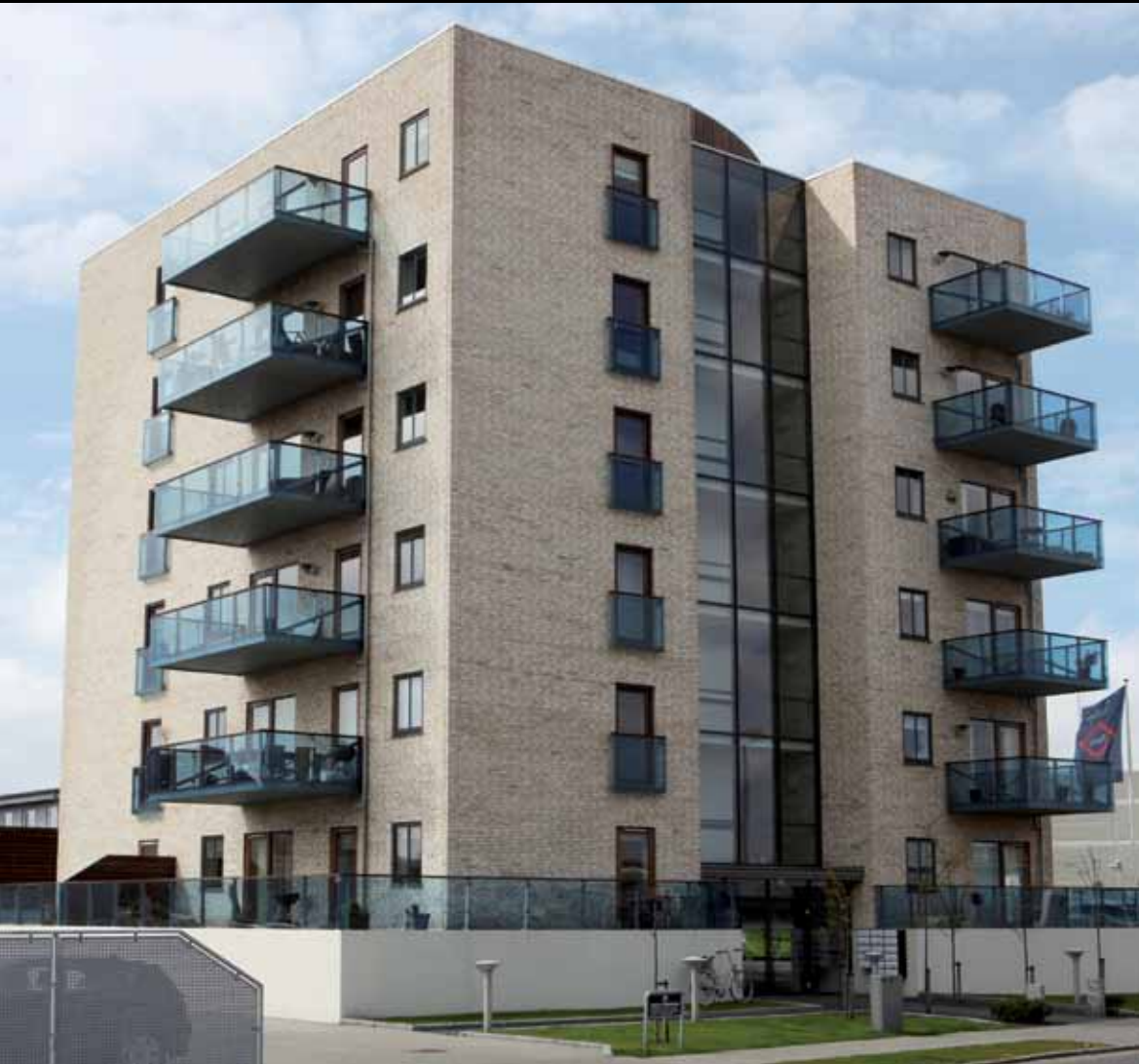
Lejlighedsprojekt i Esbjerg: 17 fantastiske lejligheder opført i 6 etager med elevatortårn og oval udsigtsterrasse på taget. Opført med kulbrændte Petersen Tegl samt blå- tonet, hærdet glas i altanrækværk. Desuden kælder med fællesfaciliteter.