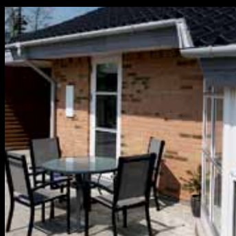
Andelsboliger i Rødekre: Beboerne tilføjer byggeriet miljø og sætter deres eget præg på boligen på forskellig vis – såvel ude som inde.