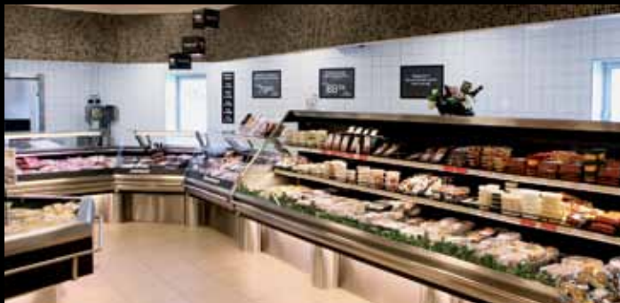
Fakta og Super Brugsen i Assens: 800m 2 Fakta-butik og 2000m 2 Super Brugs med Bake Off og egen slagter- afdeling. Desuden stor fælles P-plads med ubemandet benzintank.