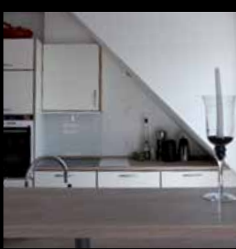
Lejlighedsprojekt i Fredericia: 9 lejligheder opført i 3 etager med P-kælder, depotrum og elevatorårn. Bygningen er opført midt i et lyskryds indenfor voldene.