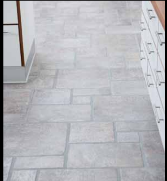
Villa i Tjæreborg: Fuldmuret H-hus med murede gesimser, zinktagrender og sorte træ/alu vinduer. I badeværelset et toilet med skjult cisterne, bruseniche med glasdør samt skuffer under vask. Klinkegulv med specialmønster i køkken/alrum.