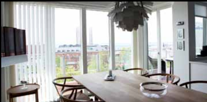
Lejlighedsprojekt i Esbjerg: 10 eksklusive lejligheder opført i 4 etager med P-kælder, depotrum og elevatortårn. Alle lejligheder har pragt- fulde altaner med udsigt til bl.a. Musikhuset og havnen.