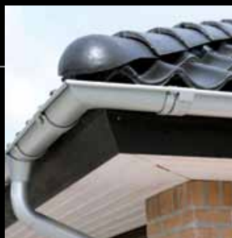
Villa i Tjæreborg: LM standardvilla med muret dobbeltgarage, ståltagrender. Loft til kip i køkken/alrum, fransk dobbeltdør til stue og 2 ovenlys i køkken/alrum samt spabad.