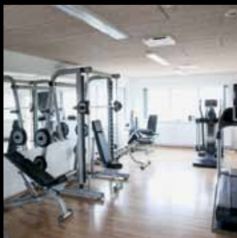
Hangar- og kontorbyggeri for DanCopter i Esbjerg: Ny helikopterhangar og udvidelse af kontorfaciliteter med bl.a. et fantastisk motionsrum til fri afbenyttelse for medarbejderne.