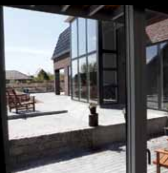
Villa i Hjerding: Specialdesignet villa med zinkkviste, store vinduespartier, altan og en mængde andre flotte detaljer. Opført i totalentreprise i samarbejde med ekstern arkitekt.