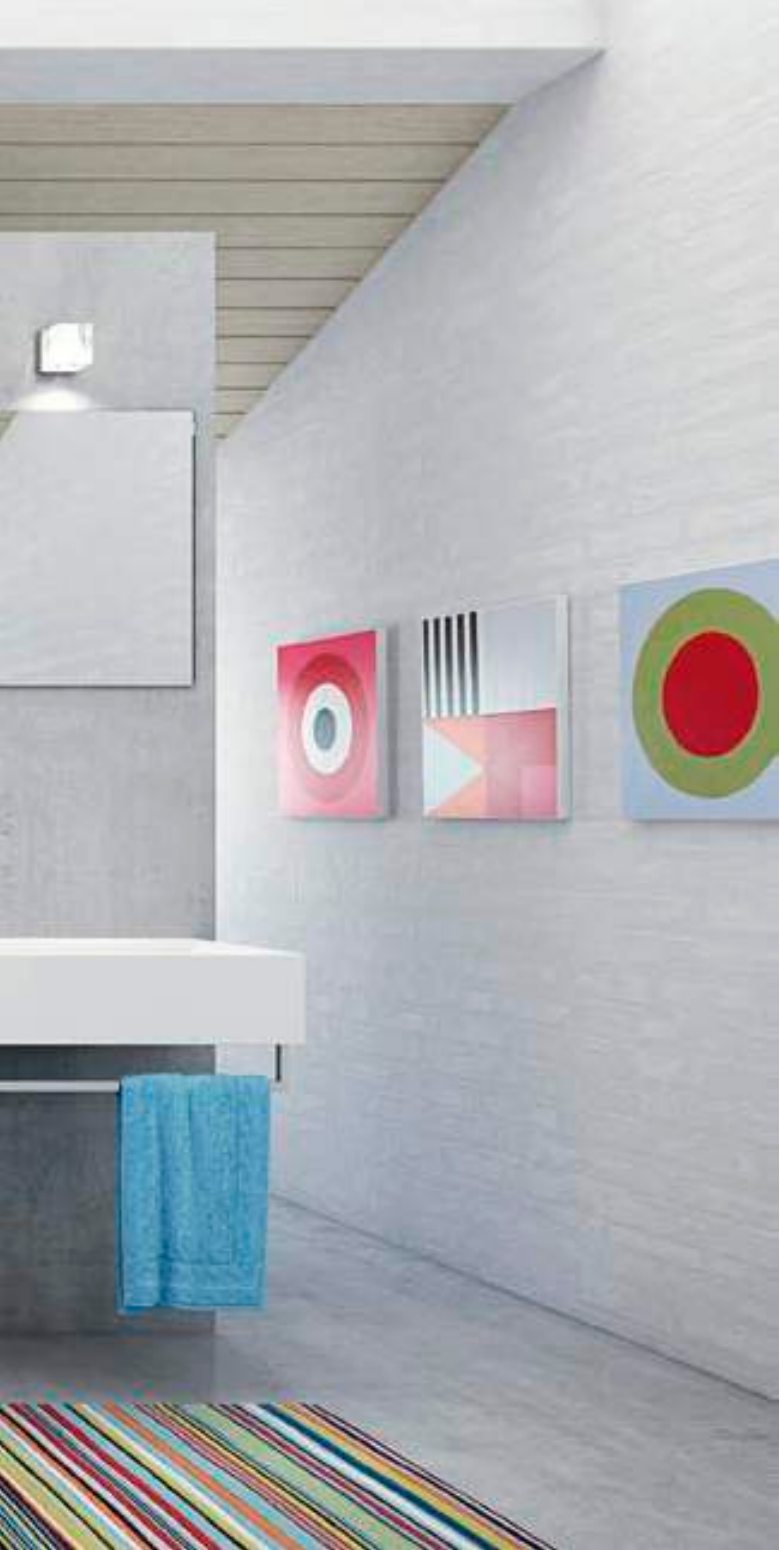
uno form Eg Classic uno form Classic oak