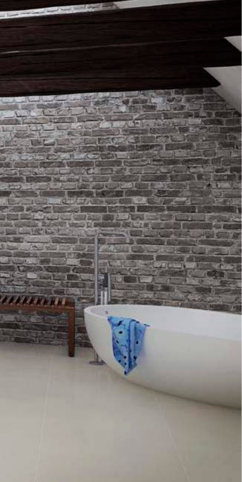
uno form Valnød uno form Walnut