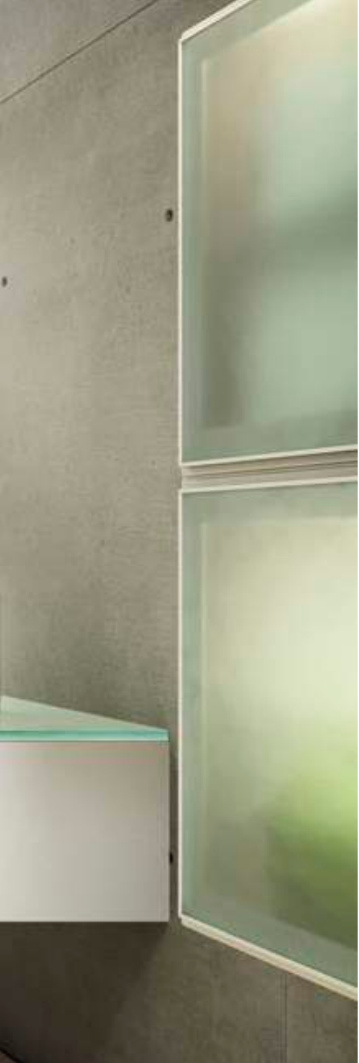
uno form A2 Wengé uno form A2 Wengé