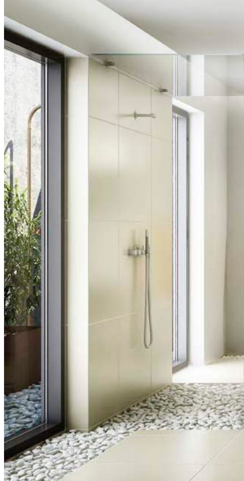
uno form A1 Black Oak uno form A1 Black Oak